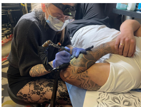
le 21 novembre 2024 dans le salon de tatouage La Bête Humaine à Paris.

Même s’il est parfois mal perçu par certains, le tatouage est ancré dans la peau de 18% des français en 2018, d’après l’IFOP. Ce chiffre en constante augmentation, a donné un nouveau tournant à cette forme d’art. Si le tatouage permet d’embellir le corps, d’exprimer une émotion et de revendiquer des idées politiques, certains ont décidé d’utiliser le tatouage comme réparateur de cicatrices. Accidents, maladies ou automutilations, tout peut être restauré grâce au tatouage.